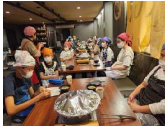
料理が完成するまで、「次回は何を作りたい?」とみんなに聞いているところ