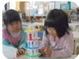
1年生同士仲良く遊びます