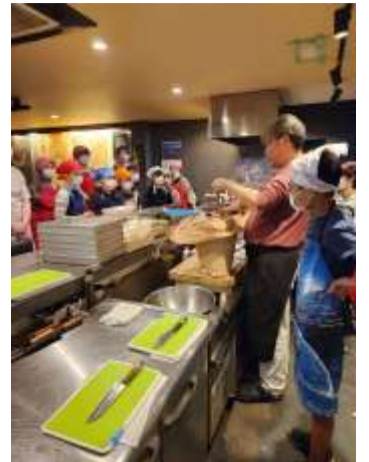
お米のとぎ方 真剣に聞いています