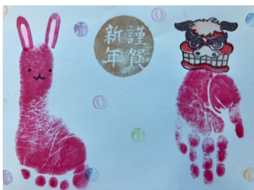
うさぎ年のお正月