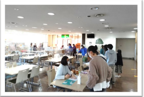
10月 道灌まつりに参加