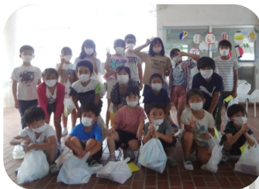
夏まつり。射的、輪投げ等楽しみました。楽しかったね。