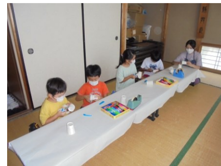
夏休み中の学習タイムの様子です。