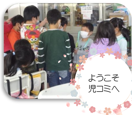
ようこそ 児コミへ