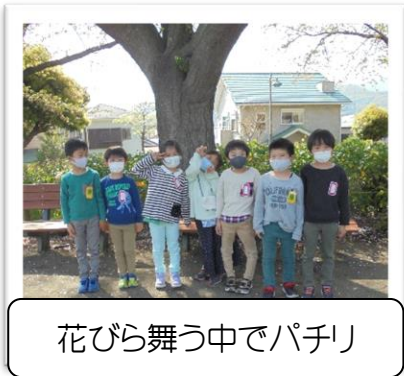
花びら舞う中でパチリ

今年は桜の開花が早かったので満開の桜を背景にして…とはいきませんでした。各児コミ では新入生歓迎会をしました。上級生から手作りのメダルをかけてもらったり、自己紹介を したりとちょっぴり緊張した時間をすごしました。