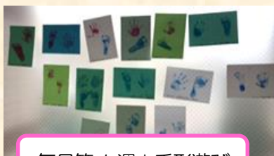
毎月第1週 ☆ 手形遊び