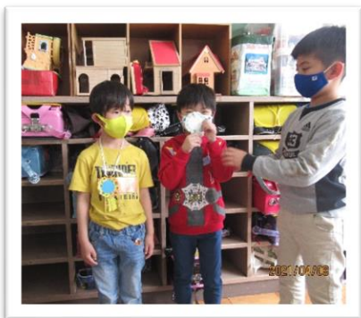
仲良くしましょうね。一緒に遊ぼうね！