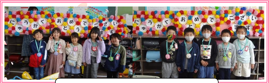
1年生です。よろしくお願いします。