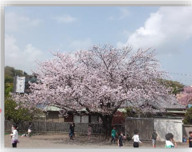
今年も綺麗に咲いてくれた桜の前で撮りました♡