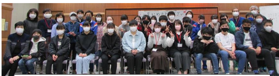
2021. 3. 22お別れ会★楽しく温かい時間が過ごせました

私は今春から医師として働き始めます。やりたいと思ったことを諦めず日々努力したことで、目標に到達することができました。これから学習サポートに来る学生さん、やりたいと思ったら、目標を諦めずトコトンやり抜いてみてください。苦しい時はスタッフ一同寄り添いながらサポートしてくれますよ。