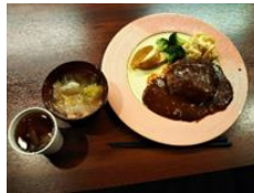
◆4月11日献立◆ ハンバーグ、スープ