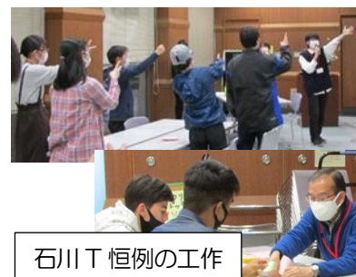
石川 T 恒例の工作