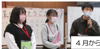
4月から中学校の先生

この春、学習サポートみらい・つなぐでは中学3年生が卒業されましたが、他にも卒業された方がいらっしゃいます。それは私たちスタッフと一緒に日々児童・生徒たちをサポートしてくれた学生サポーター（支援員）です。大学、大学院で医学、教育、福祉、心理などを学んでいる学生さんで、子どもたちに学習支援や進路相談のアドバイスをしてくれました。