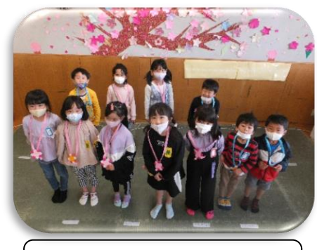
自己紹介緊張しました。