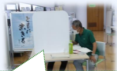
フェイスシールドと立板を使用