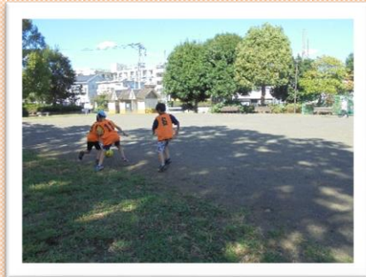
学校の振り替え休日に近くの公園にでかけました。ボール遊び、遊具で楽しみました。