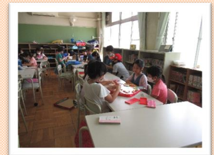
友達と仲良く遊ぶ