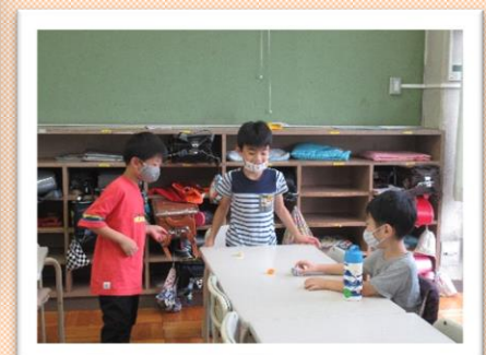
ペットボトルのキャップゴマ、よく回るかな？