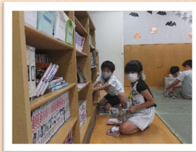
本棚の整理整頓、ありがとう!!