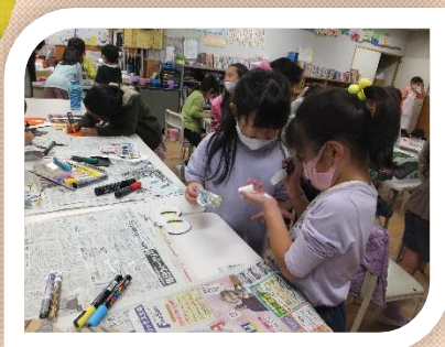
ハロウィンの仮面作り、友達と一緒に