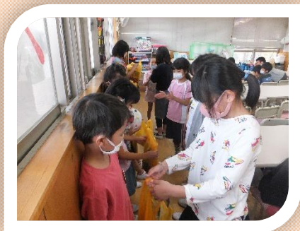
誕生日おめでとう！はい、プレゼント。