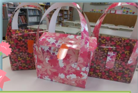
母の日に向けてバッグを作りました。