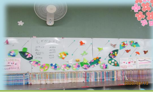
水色厚紙を背景に6月の壁飾りです。

6月13日(土)に「伊勢原青年会議所」の有志の方々により4児コミの部屋のアルコール消毒(拭き)・光触媒をしていただきました。皆さん手際よく作業を進められチームワークの良さを感じました。子ども達、支援員は安心して過ごすことができます。ありがとうございました。