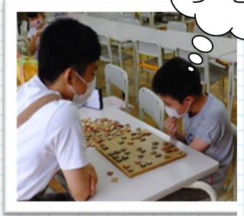
学生アルバイトのお兄さんと将棋をさしました。