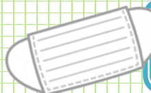
(株)トーシン様より「マスク」を比々多第2児コミにご寄付頂きました。

地元企業、保護者の方からマスク、消毒液などご協力いただきました。ありがとうございました。有効利用させていただいています。