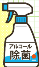
(有)高橋設計様より「アルコール消毒・ダスター」をいただきました。

地元企業、保護者の方からマスク、消毒液などご協力いただきました。ありがとうございました。有効利用させていただいています。