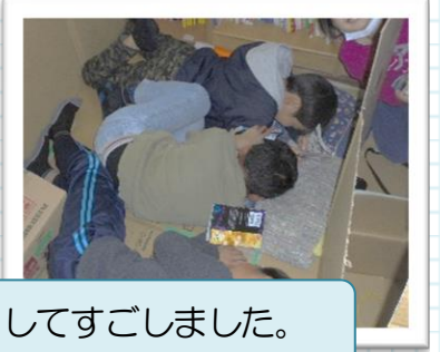
おやつを食べたり、本を読んだりしてすごしました。