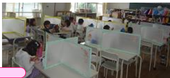
支援員お手製の 衝立です。 おやつ時、昼食時 に使用しました。