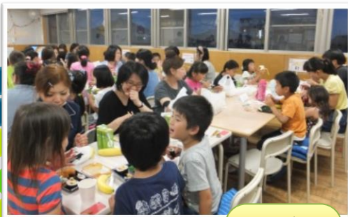
みんなでワイワイ