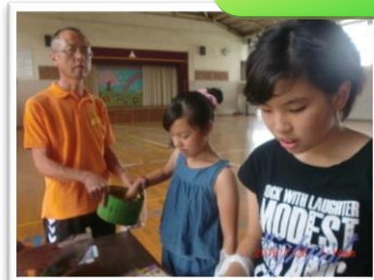
先生お手伝いありがとうございました