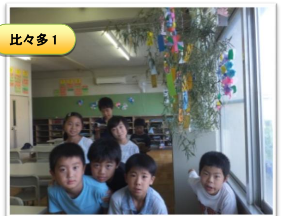
短冊に願いを書きました