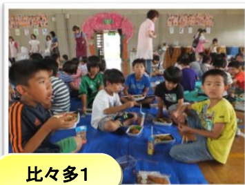
友達と食べるの 楽しい