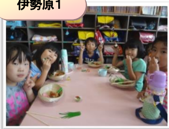
お弁当、おいしいね