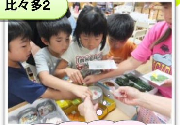
タイル、どれにしよう