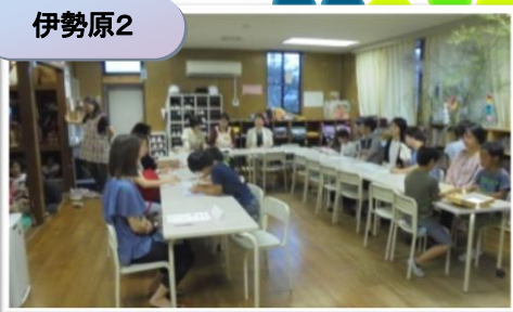
夏休み利用の説明です