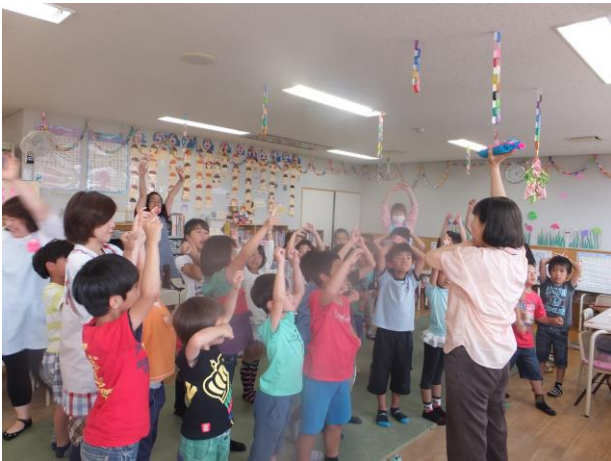
♪ ダンベル体操はリズムに合わせて ♪