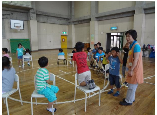
イス取りゲーム 「これは私のイス だから取らないで……」

6月2日(月)は運動会の振替休日。伊勢原第1・2児童コミュニティ合同で小学校の体育館を使わせてもらひ、にぎやかに楽しい時間を過ごしました。