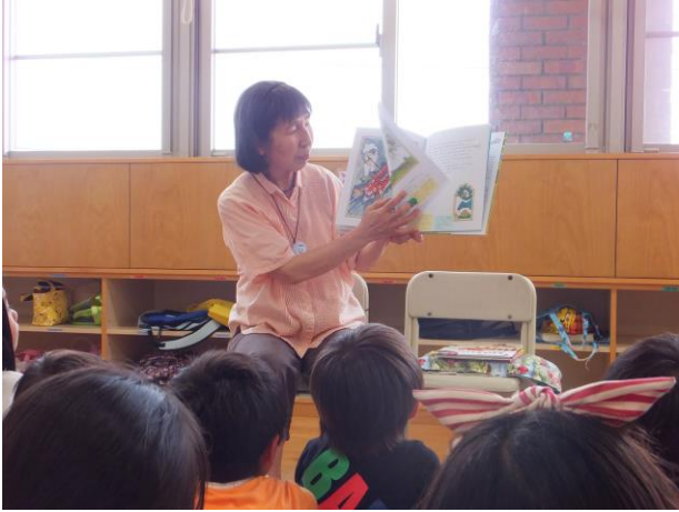
方言の入った語りに子どもたちも夢中

比々多第1・第2コミュニティで楽しい読み聞かせをして頂いた後、ダンベル体操で体を動かしました。