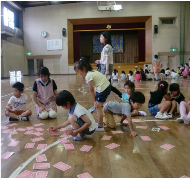
大きなトランプを使つてのゲームは「神経衰弱」

保護者の皆さま、お子さまとの会話の中に児童コミュニティですごす時間の話題は出ていますか。放課後の安心・安全を考慮した環境作りに心がけて、1年生～4年生が一緒にすごす集団の中で学び合い、社会性を培い健やかな成長を、保護者の皆さま、地域の皆さまのご協力を頂きながら指導員共々見守らせて頂きたいと思ひます。