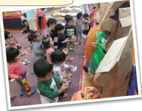
仮装して保育園訪問