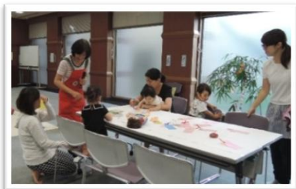
短冊に願いを込めて

7月7日(火)七夕の日にユーコープのボランティアの皆様にお越しいただき、参加者(親子)に短冊に願いごとを書いてもらいました。その後、食育アドバイザーの方から食育についてのお話があり、皆さんで3種類のお菓子とジュースを試食、ひととき、楽しみました。