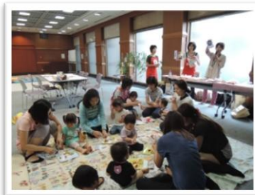
ひじきせんべい、かぼちゃのようかん、 かんたんおこしの試食