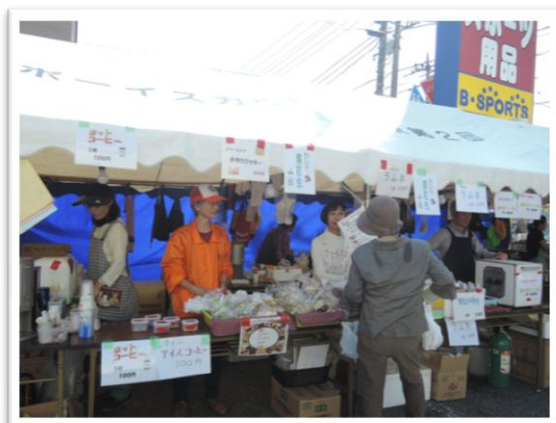
いらっしやいませ～