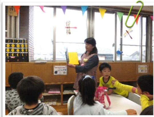
比々多2 お月さまのお話し