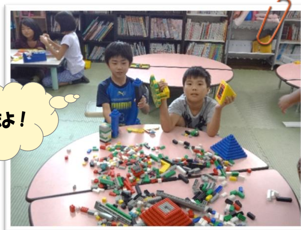
伊勢原1 ピラミッド出来たよ