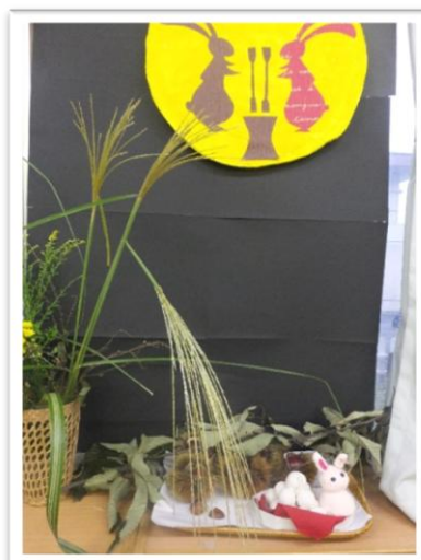
比々多1 きれいに飾る