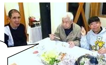
被後見人さん グループホーム 入所試行の様子

また、平成24年4月1日より国から市町村長に権限が移譲され、市民後見人の養成を強化し、地域における市民後見人の活動推進事業を支援する方向に転換しました。もとより市民目線を大切に身上監護に当たって来た私たちは勿論大歓迎で、地元での養成講座の開催を期待しつつ、市社協と共に後見人を強化する活動にも参画していきたいと願っています。