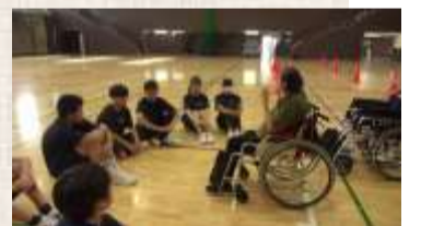
車いす利用者のお話に熱心に耳を傾けます