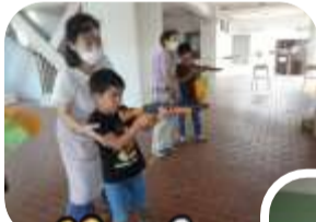
夏祭りの一コマです。射的、輪投げ、すくいもの