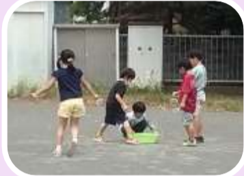
保育園の年長さん達が来てくれました。トトロ先生に「スライム」を教えて頂きました